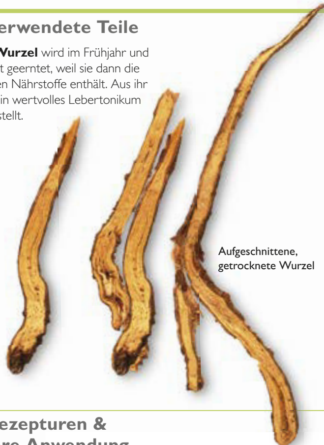
Aufgeschnittene, getrocknete Wurzel

Die Wurzel wird im Frühjahr und Herbst geerntet, weil sie dann die meisten Nährstoffe enthält. Aus ihr wird ein wertvolles Lebertonikum hergestellt.