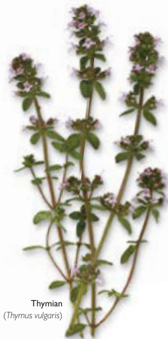
Thymian ( Thymus vulgaris )

Die medizinischen Wirkungen einiger Pflanzen sind bestens bekannt. So wird die Echte Kamille schon seit Jahrtausenden zur Linderung von Verdauungsbeschwerden verwendet, und die Echte Aloe soll schon von Kleopatra als linderndes Hautmittel benutzt worden sein. Die Wirkstoffe, deren genauer Aufbau durchaus zum Verständnis ihrer Wirkungsweise im Körper beitragen kann, wurden dagegen erst vor relativ kurzer Zeit genau untersucht.