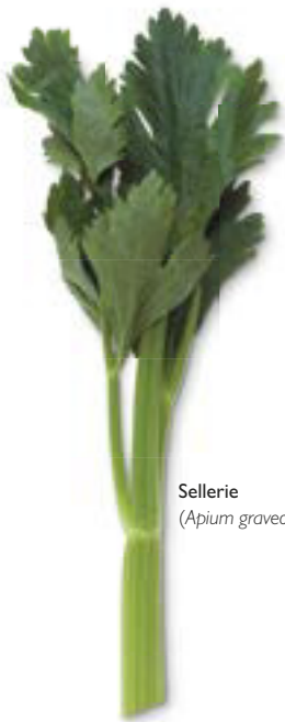
Sellerie ( Apium graveolens )

Die in vielen Pflanzen enthaltenen Kumarine können recht unterschiedliche Wirkungen haben. So verdünnen die des Steinklees ( Melilotus officinalis , S. 234) und der Gemeinen Rosskastanie ( Aesculus hippocastanum , S. 58) das Blut, während Furanokumarine, etwa das Bergapten aus Sellerie ( Apium graveolens , S. 64), in Sonnenschutzmitteln verwendet wird. Das im Zahnstoeckerkraut ( Ammi visnaga , S. 62) vorkommende Khellin ist dagegen ein wirksames Relaxans für die glatte Muskulatur.