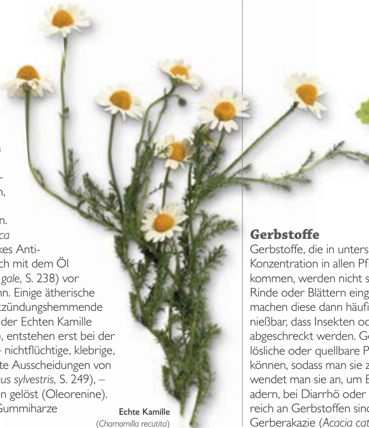
Echte Kamille ( Chamomilla recutita )

Die durch Wasserdampfdestillation gewonnenen ätherischen Öle sind nicht nur wichtige, therapeutisch wirksame Pflanzeninhaltsstoffe, sondern werden häufig auch in der Parfümherstellung verwendet. Es handelt sich um komplexe Mixturen, die oft bis zu 100 verschiedene Substanzen enthalten, die in unterschiedlichster Weise angewendet werden. So ist Teebaumöl ( Melaleuca alternifolia , S. 112) ein starkes Antiseptikum, während man sich mit dem Öl des Gagelstrauchs ( Myrica gale , S. 238) vor Stechmücken schützen kann. Einige ätherische Öle, beispielsweise das entzündungshemmende und antiallergene Matricin der Echten Kamille ( Chamomilla recutita , S. 77), entstehen erst bei der Dampfdestillation. Harze – nichtflüchtige, klebrige, zumeist halb feste oder feste Ausscheidungen von Pflanzen, etwa Kiefern ( Pinus sylvestris , S. 249), – sind oft in ätherischen Ölen gelöst (Oleorenine). Gleiches gilt auch für die Gummiharze (siehe Polysaccharide).