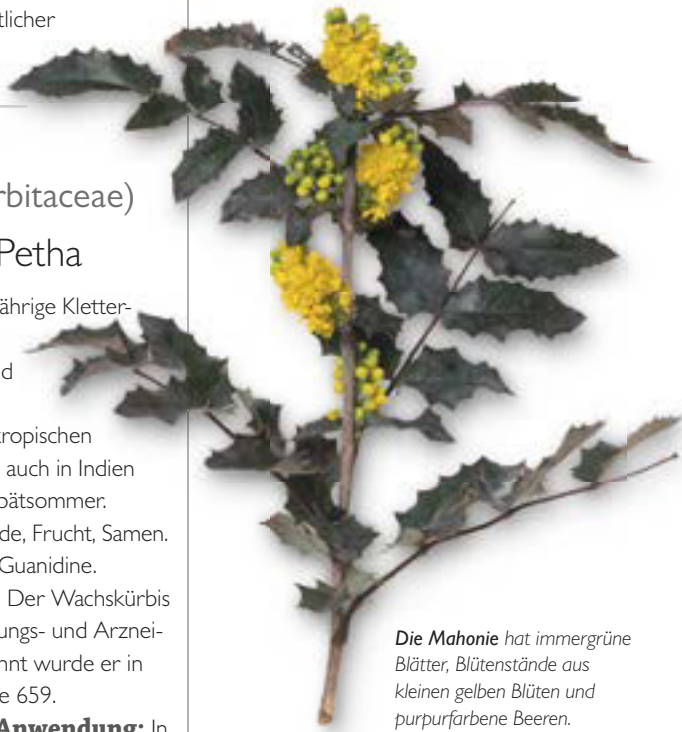
Die Mahonie hat immergrüne Blätter, Blütenstände aus kleinen gelben Blüten und purpurfarbene Beeren.

Inhaltsstoffe: Isochinolinalkaloide (darunter Berberin, Berbamin und Hydrastin). Diese haben