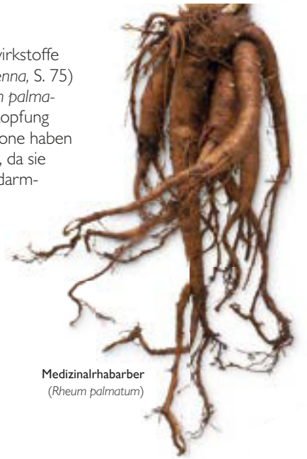
Medizinalrhabarber ( Rheum palmatum )

Anthrachinone sind die Hauptwirkstoffe in Pflanzen wie Kassie ( Cassia senna , S. 75) und Medizinalrhabarber ( Rheum palmatum , S. 126), die beide bei Verstopfung verwendet werden. Anthrachinone haben eine stark abführende Wirkung, da sie heftige Kontraktionen der Dickdarmwand verursachen, sodass etwa zehn Stunden nach Einnahme der Stuhlgang einsetzt. Außerdem machen sie den Stuhl weicher und erleichtern dadurch die Darmtätigkeit.