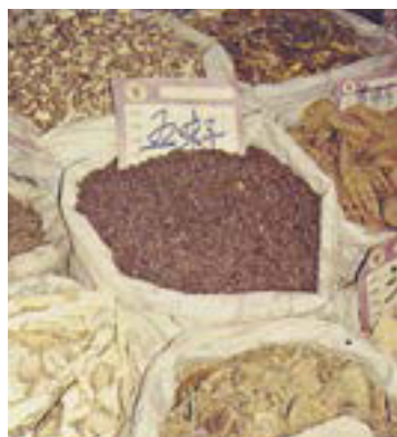
Das Chinesische Hasenohr ist in den meisten Kräutlerläden Chinas leicht zu bekommen. Verwendet wird es zumeist als Lebertonikum .

Das Chinesische Hasenohr wurde erstmals in Texten aus dem 1. Jahrhundert v. Chr. erwähnt und ist eins der chinesischen »Harmoniekräuter«. Es wird als Tonikum verwendet, das die Verdauungsfunktionen stärkt, die Lebertätigkeit verbessert und Blut zur Körperoberfläche pumpt. Neuere Forschungen in Japan haben gezeigt, dass die Pflanze tatsächlich die Leber schützt und damit die traditionelle Verwendung bestätigt.