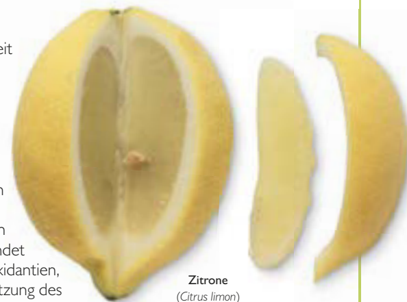
Zitrone ( Citrus limon )

Die im Pflanzenreich weit verbreiteten Flavonoide sind polyphenolische Substanzen, die gelb oder weiß sein können. Sie verleihen Blüten oder Früchten oft ihre Farbe. Flavonoide haben ein breites Wirkungsspektrum und können in vielerlei Weise angewendet werden, etwa als Antioxidantien, aber auch zur Unterstützung des Kreislaufs. Andere wirken dagegen entzündungshemmend oder werden als Virustatika eingesetzt. Flavonoide wie Hesperidin und Rutin, die man etwa im Buchweizen ( Fagopyrum esculentum , S. 210) oder in der Zitrone ( Citrus limon , S. 82) findet, stärken die Kapillargefäße; Isoflavone, die beispielsweise im Wiesenklees ( Trifolium pratense , S. 277) vorkommen, wirken östrogen, sodass man sie bei Beschwerden während der Menopause einsetzen kann.