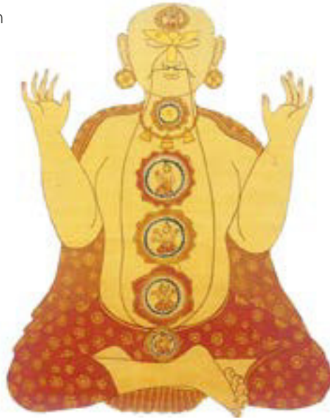
Chakras sind Energiezentren, die, wie im Bild dargestellt, entlang der Wirbelsäule angeordnet sind. Das auf der ayurvedischen Lehre beruhende medizinische System Indiens kennt sieben solcher Zentren. Sind sie blockiert, kommt es zu Krankheiten.

einer gegenseitigen Befruchtung von Ayurveda, Siddha-Medizin sowie traditioneller chinesischer Medizin und den Praktiken der Griechen und Römer. Von etwa 700 n. Chr. an, nachdem die klassischen griechischen Texte ins Arabische übersetzt worden waren, entwickelte sich die griechische Medizin, die auf den hippokratischen Grundsätzen beruhte, in der arabischen Welt weiter. Diese Tradition, die als Unani-Medizin bekannt ist, war einmal von Indien bis Spanien verbreitet und ist auch heute noch eine im Nahen Osten häufig praktizierte Kräutermedizin.