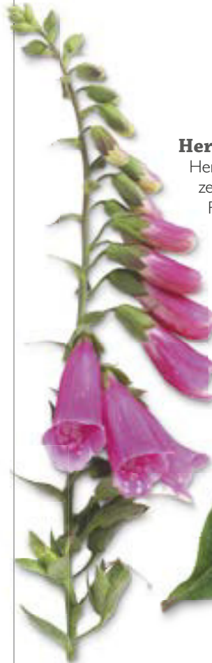
Roter Fingerhut ( Digitalis purpurea )

Herzglykoside kommen in verschiedenen Heilpflanzen vor, besonders aber in Fingerhutarten (siehe Roter Fingerhut, Digitalis purpurea , S. 202) und in Maiglöckchen ( Convallaria majalis , S. 194). Herzglykoside wie Digitoxin, Digoxin und Gitoxin haben eine starke Wirkung auf das Herz, da sie die Aktivität steigern oder auch die Kontraktionskraft erhöhen können. Herzglykoside wirken aber auch harntreibend und sorgen dafür, dass Flüssigkeit aus dem Gewebe und dem Kreislaufsystem in den Harntrakt überführt wird, was wiederum zu einer Blutdrucksenkung führt.