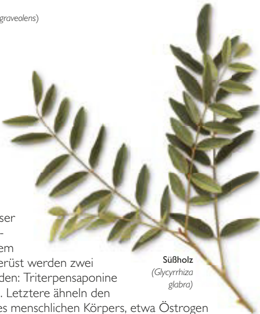
Süßholz ( Glycyrrhiza glabra )

Saponine verdanken ihren Namen der Tatsache, dass sie in Verbindung mit Wasser seifenähnliche Lösungen bilden. Nach ihrem chemischen Grundgerüst werden zwei Gruppen unterschieden: Triterpensaponine und Steroidsaponine. Letztere ähneln den Steroidhormonen des menschlichen Körpers, etwa Östrogen und Cortisol, und wenn Steroidsaponine in Pflanzen enthalten sind, zeigen diese oft auch eine Hormonaktivität, etwa die Wilde Yamswurzel ( Dioscorea villosa , S. 91), mit deren Hilfe einst die erste Antibabypille entwickelt wurde. Triterpensaponine, die im Süßholz ( Glycyrrhiza glabra , S. 101) oder in der Schlüsselblume ( Primula veris , S. 256) vorkommen, sind oft starke Expektorantien und können außerdem die Aufnahme von Nährstoffen erleichtern.