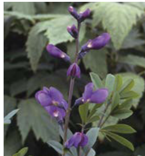
Wilder Indigo wurde von den Penobscot-Indianern als Wundheilmittel verwendet.