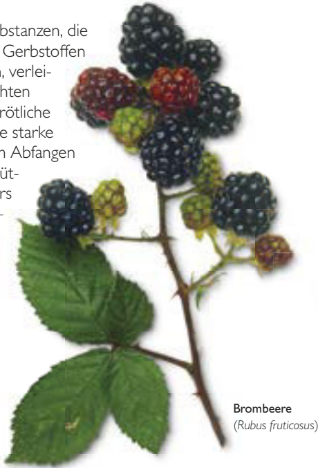
Brombeere ( Rubus fruticosus )

Diese polyphenolischen Substanzen, die eine starke Ähnlichkeit mit Gerbstoffen und Flavonoiden aufweisen, verleihen vielen Blüten und Früchten ihre blaue, purpurne oder rötliche Färbung. Außerdem sind sie starke Antioxidantien, dienen dem Abfangen freier Radikale und unterstützen den Kreislauf. Besonders Brombeeren ( Rubus fruticosus , S. 264), Weintrauben ( Vitis vinifera , S. 283) und Weißdorn ( Crataegus laevigata , S. 87) enthalten beträchtliche Mengen an Proanthocyanen.