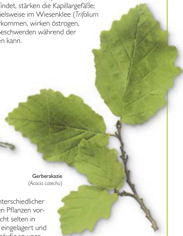
Gerberakazie ( Acacia catechu )