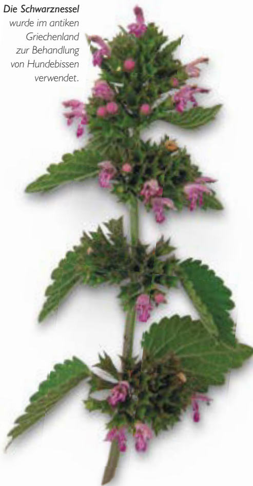
Die Schwarznessel wurde im antiken Griechenland zur Behandlung von Hundebissen verwendet.

zenheilkundlern wird sie gegen Brechreiz und Übelkeit eingesetzt, besonders, wenn diese auf Störungen im Innenohr beruht. Außerdem soll die Pflanze leicht beruhigend und krampflösend wirken und gelegentlich bei Arthritis und Gicht verwendet werden.