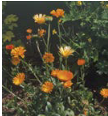
Ringelblumenblüten sollen aufmunternd wirken.

Die Ringelblume ist eine der vielseitigsten Heilpflanzen in der westlichen Kräutermézin. Die Blütenblätter sind ein gutes Mittel bei angegriffener Haut. Außerdem helfen ihre antiseptischen Eigenschaften, die Ausbreitung von Infektionen zu verhindern und die Wundheilung zu beschleunigen. Die Ringelblume ist auch ein reinigendes und entgiftendes Kraut, sodass man Aufgüsse und Tinkturen bei chronischen Infektionen verwenden kann.