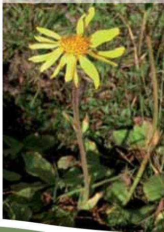
Berg-Arnika ( A. montana )