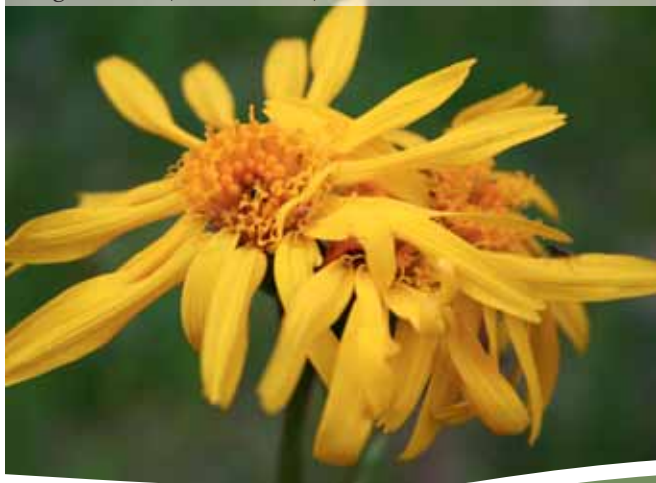
Berg-Arnika ( A. montana )

Arnikaöl (Ölauszug von Arnikablüten in Olivenöl) ist als Grundlage für Salben und Massageöle bei den genannten Indikationen sehr bewährt und beliebt, v. a. bei