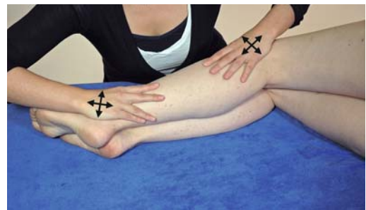
► Abb. 11.11 Behandlung Fibula kaudal.