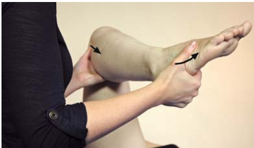
► Abb. 11.5 Behandlung der Fibula kranial.

Der Daumen der kranialen Hand mobilisiert das Fibulaköpfchen sanft nach kaudal (► Abb. 11.5). Zeitgleich wird der Fuß immer weiter in eine Supinationsstellung gebracht, um so über die Bänder die Fibula nach kaudal zu ziehen, bis sie ihren physiologischen Stand zurückgewonnen hat.