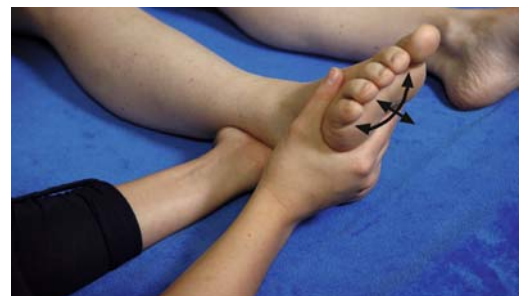
► Abb. 11.13 Behandlung des oberen und unteren Sprunggelenks nach Supinationstrauma.

Vorgehen Eine Hand wird in Höhe der Malleolengabel aufgelegt, die andere Hand umgreift den Fuß von plantar (► Abb. 11.13). Das Gewebe zwischen den Händen wird in seiner Gesamtheit anzeigen, wo es hin möchte. Der Therapeut ist lediglich behilflich, diese Positionen passiv mit einzustellen. Möchte der Fuß in eine Supinationsstellung, so hilft der Therapeut ihm, sich dort hinzubewegen. Als nächstes könnte eine Plantarflexion dazukommen, der man wieder behilflich ist usw. Je nachdem, wie groß das Trauma war und wie viele Strukturen beteiligt daran waren, muss der Therapeut eventuell neue Auflagepositionen für seine Hände einnehmen (z.B. Richtung Fibulaköpfchen oder Becken), um den Strukturen zu helfen, sich in der Traumaposition einzustellen. Diese Prozedur wird so lange verfolgt, bis alle beteiligten Strukturen in der Traumaposition verweilen und das Release stattfinden kann.