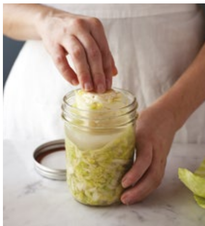
Mit dem Strunk beschweren