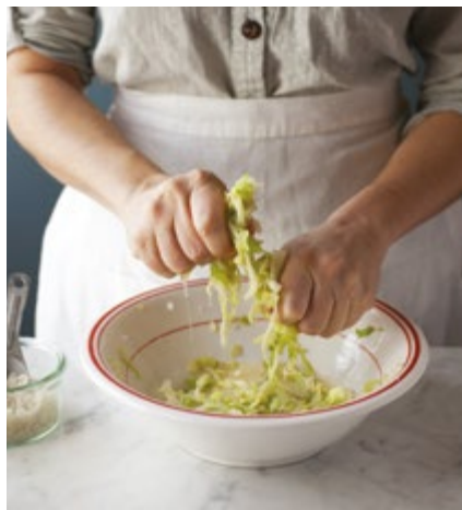
Weiterkneten, bis sich die Lake sammelt