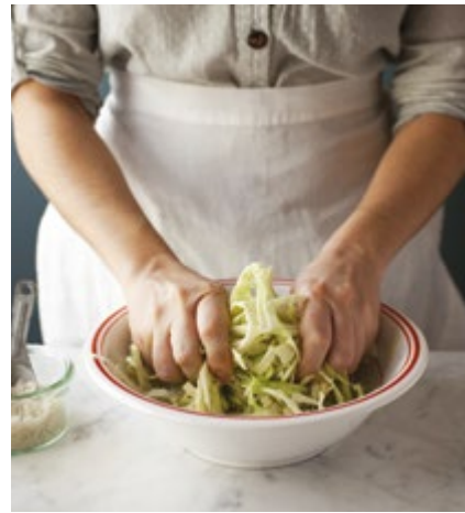
Den Kohl durchkneten