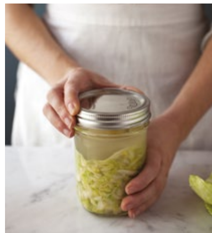
Das Glas verschließen und abwarten