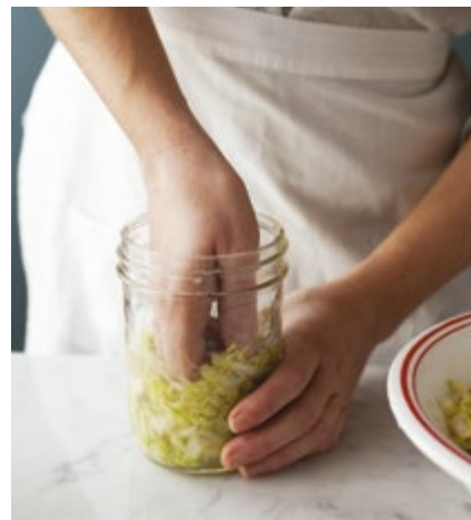
Den Kohl zusammenpressen