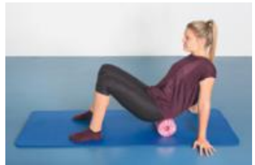
► Abb. 7.6 Rollout der Lumbalfaszie (eher lokal begrenzt) mit Mobilisation der intervertebralen Foraminae und der neuralen Austrittsbereiche des Plexus lumbosacralis, im Sinne einer Eigenbehandlung der mechanischen Kontaktflächen.

Im unteren Lumbalbereich, in der Übergangszone zum Os sacrum, können lokale Rollouts in der hintersten Kontur des Os ilium und am Os sacrum ausgeführt werden (► Abb. 7.6 ). Dazu befindet sich der Patient mit dem Becken auf der Rolle. Die Füße sind aufgestellt und beide Hände werden hinter dem Oberkörper auf dem Boden abgestützt. So kann der Patient das lokale Rollout gut kontrollieren und die Fascia thoracolumbalis intensiv bearbeiten. Aufgrund der multidirektionalen Ausrichtung der Fasern ist eine Veränderung der Oberkörperposition (mal mehr oder weniger Rotation und Lateralflexion) während des Rollouts zielführend. So können die Deformationsreize auch in alle Richtungen der Fascia thoracolumbalis wirken und die Effektivität der Rolloutbewegungen deutlich steigern.