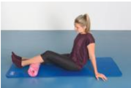
► Abb. 7.3 Rollout mit geringer Belastung, von der Achillessehne bis zur Mitte des M. gastrocnemius.

Die Backline setzt sich über die Achillessehne und den M. gastrocnemius in den Unterschenkel fort. Genau dort setzt die 2. Faszienübung mit dem Rollout an. Ein lokales Rollout an den knöchernen Fixpunkten (Kalkaneus und medialer+lateraler Malleolus sowie in der Kniekehle Condylus medialis et lateralis femoris) gibt der faszialen Struktur zunächst mehr Bewegungsfreiheit, bevor die globalen Rollouts entlang der myofaszialen Kette des M. gastrocnemius Adhäsionen, hypertone Muskelfasern und extraneurales Kontaktgewebe löst.