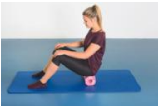
► Abb. 7.5 Rollout der Fascia thoracolumbalis im unteren Abschnitt + N. ischiadicus, Mobilisation mit extraneuralem Hüll- und Kontaktgewebe.

Die Fascia thoracolumbalis inseriert am Os sacrum und an der Crista iliaca und neigt im lumbalen Verlauf zu strukturellen Veränderungen. Unter anderem kommt es hier immer wieder zu einer Ausdünnung der Struktur, zu Adhäsionen aufgrund von Mikrotraumatisierungen des fasziellen Gewebes und zu chaotischen Faserverläufen, einer sog. pathologischen Ausbildung von Crosslinks. Um diese Veränderungen direkt anzugehen, ist die nächste Übung genau auf diese anatomische Region ausgerichtet. Das Rollout von Os sacrum und Crista iliaca kann bequem im Sitzen auf der Rolle gestartet werden. So können, ausgehend vom Tu-