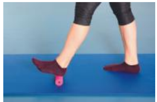
► Abb. 7.2 Rollout der Plantarfaszie beidseits mit Schwerpunkt links.

seitigt (► Abb. 7.2 ). Dieses Rollout kann sowohl im Stand als auch in einer sitzenden Ausgangsposition durchgeführt werden. Im Stehen kann mehr Druck auf die Rollbewegung ausgeübt und damit die Intensität auch noch während der Übung variiert und gesteuert werden. Dabei kann die Rollbewegung auch an den medialen oder lateralen Fußrand verlagert werden. Die Hauptdruckrichtung bleibt dabei vom Kalkaneus in Richtung Metatarsophalangealgelenke MTP I oder MTP V, also von proximal nach distal gerichtet. Alternativ kann der Druck der Rollbewegung auch umgekehrt appliziert werden, also während des Rollouts von distal nach proximal.