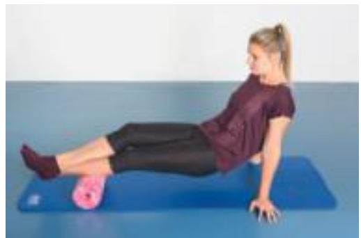
► Abb. 7.4 Rollout mit maximaler Belastung, aufeinander gelegte Beine.

Ein angehobenes Becken und ein aufgelegtes Bein vergrößern die Reichweite der Rolloutbewegung immens. So kann ein globales Rollout vom