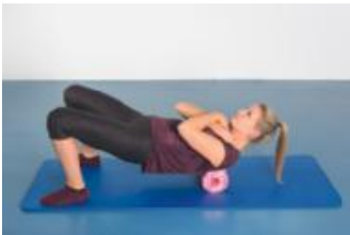
► Abb. 7.7 Globales Rollout der Fascia thoracolumbalis.

Nach der 1. Behandlungssitzung mit dem Schwerpunkt auf der Instruktion von aktiven Faszienübungen waren bereits folgende Veränderungen zu verzeichnen: