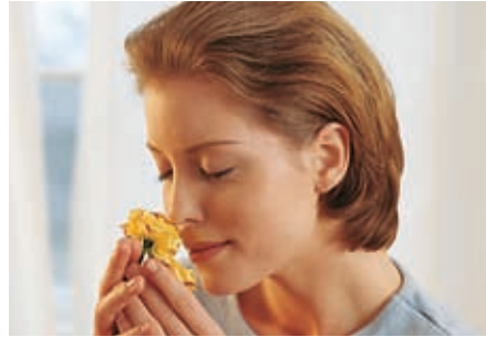
Rosenduft heilt Körper und Seele gleichermaßen.