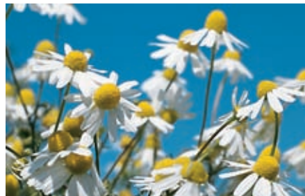
Angenehm mild und heilsam – das Aroma der Kamille.