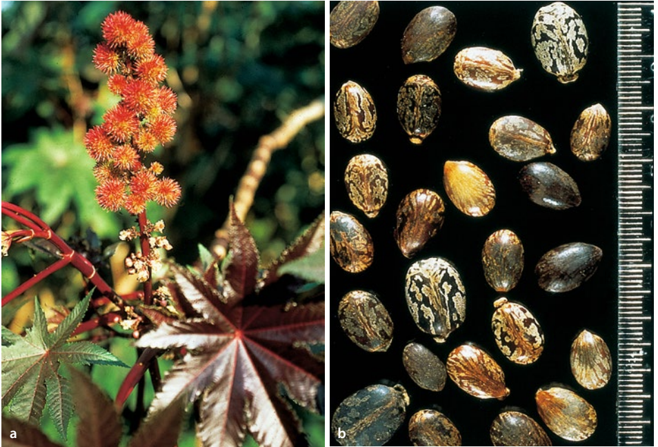
■ Abb. 10.5a,b Rizinus (Wunderbaum), a Blütenstand, b Samen

Blütenhülle. Die männlichen Blüten, die viele Staubblätter haben, befinden sich im unteren, die weiblichen im oberen Teil des traubigen Blütenstandes. Die Frucht ist eine 3-fährige Kapsel mit 3 bunten, zeckenähnlichen Teilfrüchten. Blütezeit: Juli–August.