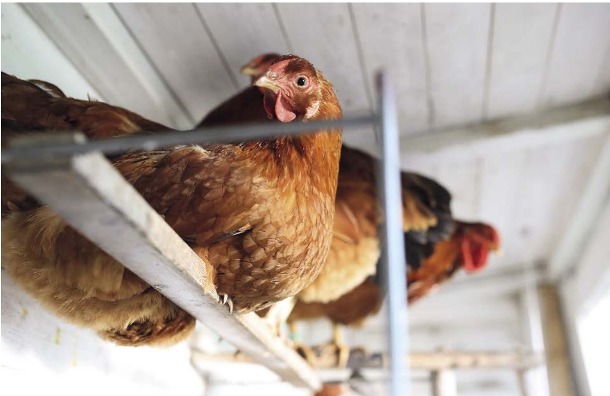
Fast alle meine Hühner setzen sich zum Schlafen auf die sprichwörtliche Stange. Nur ein einziges sitzt lieber auf dem Brett darunter.

eines großen Netzes wieder einzufangen, damit sie die Nacht in ihrem neuen Stall verbringen. Entgegen der Empfehlung des Züchters (ich mache nicht immer das, was man mir aufträgt) habe ich sie am nächsten Morgen aber sofort wieder rausgelassen, weil es mir das zweitägige Einsperren in dem doch recht engen Stall irgendwie nicht richtig vorkam. Und es hat trotzdem funktioniert: