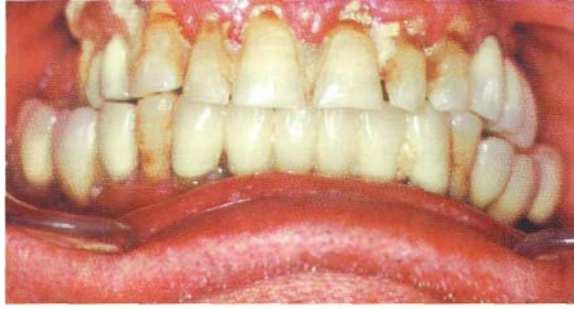
Fig. 2-11 État d'atteinte parodontale sévère avec suppuration, ulcération : Mercurius corrosivus à évaluer pour prescription (Dr Florine Boukhobza).