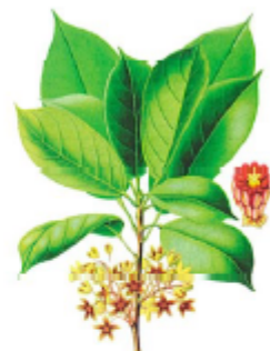
Zentrale Symptome der Kalanchoe pinnatifida sind erhöhte körperliche Leistungsfähigkeit und unstillbarer Appetit