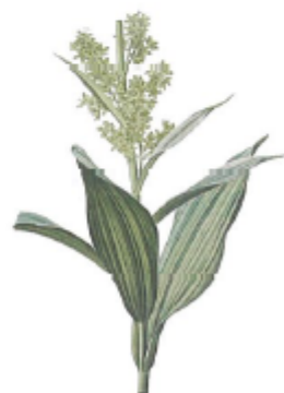
Aufmerksamkeit zu erlangen und andere (Tiere) zu küssen sind Aspekte in einem Fall des weißen Gerners Veratrum album