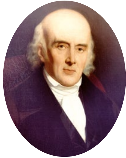
Samuel Hahnemann (1755–1843)

Ich bin zwar Homöopathin, doch keine Gärtnerin – deswegen eine Aufmunterung für alle zukünftigen „homöopathischen Gärtner(innen)“. Ich besitze einen Hausgarten und bin von Beruf weder Gärtnerin noch Botanikerin. Und vor 40 Jahren konnte ich kaum eine junge Kohlrabipflanze von einer Rose unterscheiden. Sie sehen, es ist noch kein „Meister vom Himmel ge-