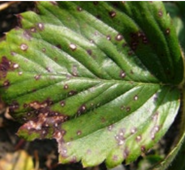
Abb. 3.22: Liegt ein Befall mit dem Erreger der Weißfleckenkrankheit vor, so zeigen die Flecken ein weißes Zentrum, das bei Befall mit der Rotfleckenkrankheit fehlt.