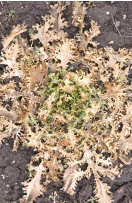
Abb. 4.28: Vernachlässigter Frisée-Salat.