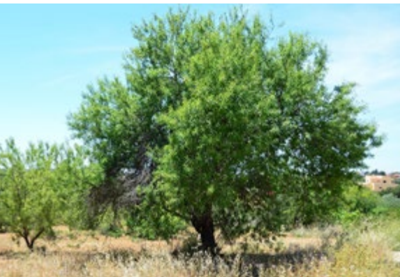
Abb. 6.38: Alter, deutlich verjüngter Mandelbaum, 1 Jahr nach der homöopathischen Behandlung, Mai 2015.