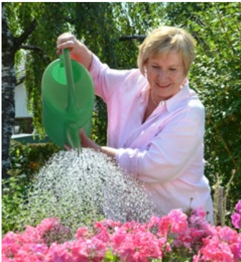
Abb. 1.7f: Gießen von Blatt- und Wurzelbereich.

Die Mengenangaben unserer Dosierungstabelle sind Circa-Angaben. Bitte vermeiden Sie Überdosierungen. Die energetische Information wirkt, nicht die Menge. Dieses Buch wurde ursprünglich für Hobbygärtner und Hobbygärtnerinnen geschrieben, damit wenigstens der Hausgarten giftfrei bleiben darf. Immer wieder werden wir gefragt, wie die Dosierung auf großen Flächen und bei großen Wassermengen ist, da mittlerweile auch landwirtschaftliche Betriebe und Gärtnereien den „homöopathischen Weg“ gehen möchten.