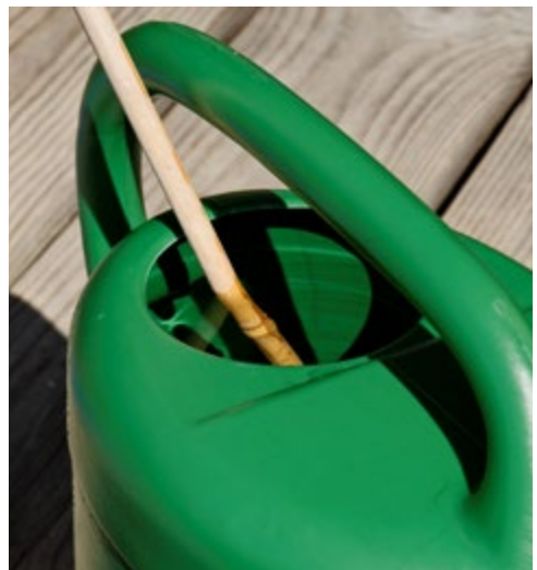
Abb. 1.7e: Gießwasser kräftig durchrühren.