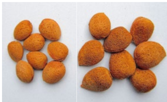
Abb. 6.40: Links: Mandelkerne eines unbehandelten Baumes. Rechts: Ernte eines behandelten Baumes.

Der Größenunterschied zwischen den unbehandelten und den homöopathisch behandelten Mandeln ist offensichtlich (→ Abb. 6.40).