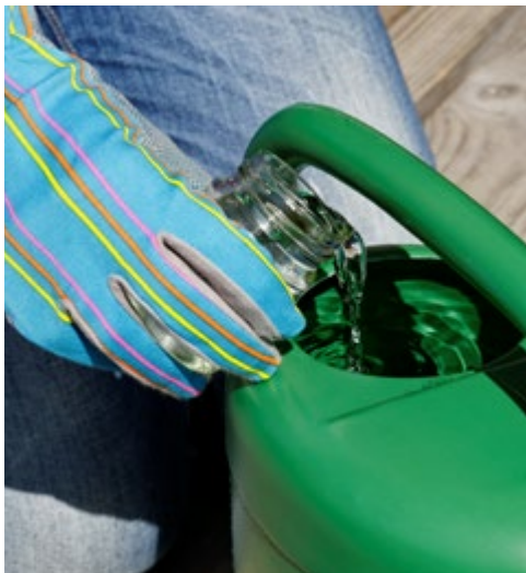
Abb. 1.7d: Aufgelöste Globuli werden ins Gießwasser gegeben.

oder Plastiklöffel verrühren. Dann mit der zweiten Hälfte ebenso verfahren.