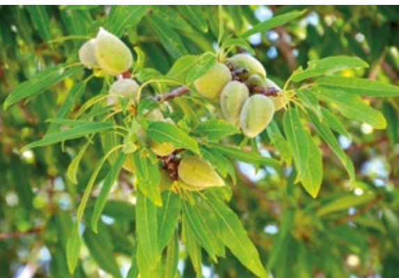
Abb. 6.39: Große, in Büscheln wachsende Mandeln, Mai 2015.