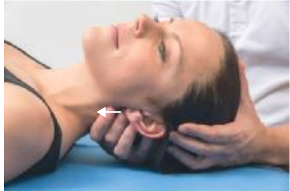
► Abb. 18.11 Technik für die A. cerebri posterior.

Die A. cerebri posterior versorgt die Strukturen der vorderen und mittleren Schädelgrube. Zu den versorgten Kortextarealen gehören – variabel angrenzend – das Medialstromgebiet, die Sehrinde und die medialen Temporalappen.