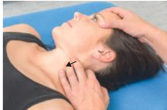
► Abb. 18.9 Technik für die A. cerebri anterior.

Die A. cerebri anterior ist ein Ast der A. carotis interna und verläuft nach medial und rostral. Beide Seiten werden durch den R. communicans anterior verbunden. Sie stellt einen häufigen Bildungsort von Aneurysmen dar.