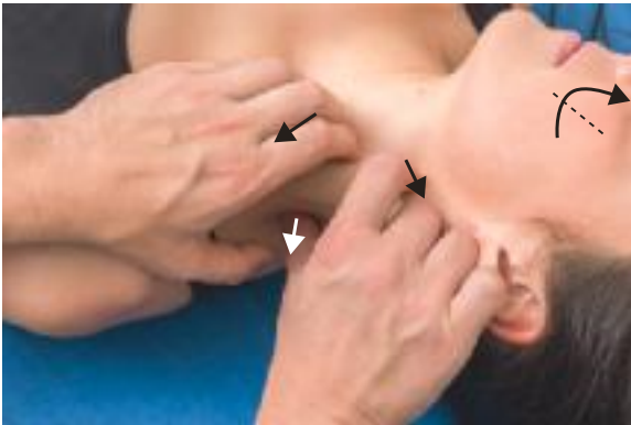
► Abb. 18.8 Technik für das Trigonum caroticum.