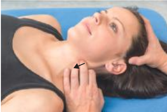
► Abb. 18.10 Technik für die A. cerebri media.

Dies ist der größte Ast der A. carotis interna. Die A. cerebri media verläuft im Sulcus lateralis (Fissura sylvii) nach lateral. Es bestehen perforierende Äste zu den Stammganglien, zur Capsula interna und Capsula externa sowie zum Klaustrum. Zu den versorgten Kortextarealen gehören u. a. sensomotorische, geschmacks-, hör- und sprachrelevante Areale. Sie bildet Anastomosen mit den Aa. cerebri anterior und posterior.