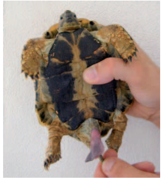
► Abb. 14.1 Vorlagerung des Hemipenis bei einer Landschildkröte. (Klinik für Vögel und Reptilien, An den Tierkliniken 17, 04103 Leipzig)

Bei weiblichen Tieren stellt der Vorfall von Oviduktgewebe eine Komplikation im Zusammenhang mit der Legetätigkeit dar, welche meist durch Störungen im Legeprozess (S.254) bedingt ist. Der Ovidukt kann durch Schwellungen, Infektionen