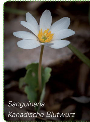
Sanguinaria Kanadische Blutwurz

Calcium carb ist langsam, fundiert, still, weich, lymphatisch; Tonsillen, Lymphdrüsen weniger hart, klarer Geist, gutes Gedächtnis ist der Hauptunterschied, Schweiß bei körperlicher (Barium bei geistiger) Anstrengung. Barium will Sicherheit, nicht Nähe, braucht viel Zeit für sich, insgesamt mehr zurückgeblieben.