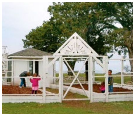
DAS IST DER GARTEN, MIT DEM CHIP MICH BEI UNSEREM FARMHAUS ÜBERRASCHT HAT!