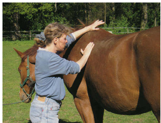
► Abb. 7.7 Mobilisation des Kostotransversalgelenks T9 links.

Eine optimal effektive Facettengelenks- und Rippengelenksseparation erhält man durch folgenden Handgriff (► Abb. 7.8): Schmiegen Sie Ihren Unterarm um die Gurtlage am Bauch an, drehen Sie den