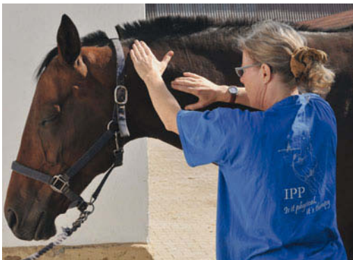
► Abb. 7.3 Mobilisation C2/3 links: Schub des Axis nach rechts sowie des HWK 3 nach sternal mit Release des Spleen.

Um eine effektive Entlastung im häufig betroffenen C2/3-Segment zu erzielen, wirkt man mit massierendem gelenknahen Ventral Schub auf HWK 3, während man den Mähnenkamm über dem Axis schräg zum kontralateralen Ohr hebt (► Abb. 7.3).