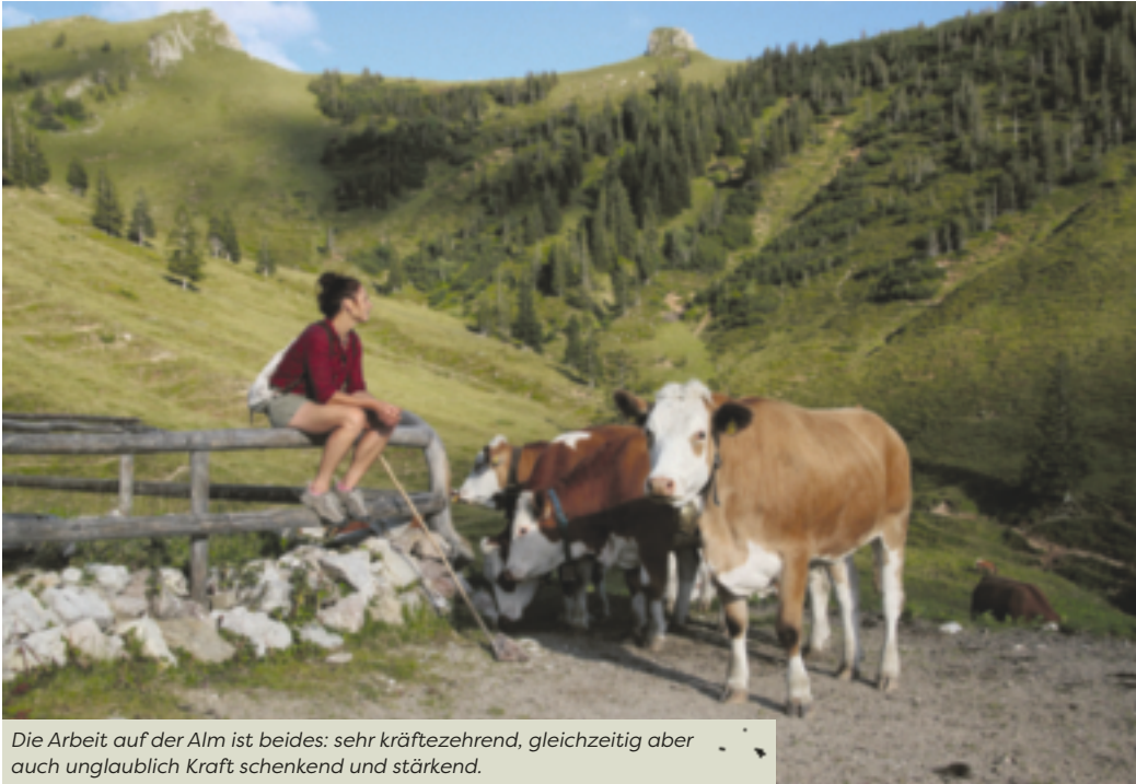
Die Arbeit auf der Alm ist beides: sehr kräftezehrend, gleichzeitig aber auch unglaublich Kraft schenkend und stärkend.

schachtelhalmen auf, die am Rand des Pfades zur Alm wuchsen. Schon lang hatte ich keine so ausgedehnten Bestände mehr angetroffen. Zu dieser Zeit machten mir meine Rückenschmerzen große Sorgen. Seit einem länger zurückliegenden, schweren Unfall tauchen sie immer wieder auf.