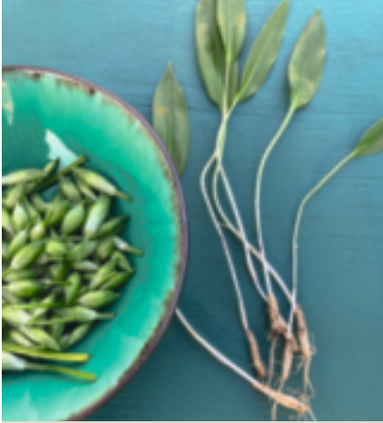
Sobald der Bärlauch blüht, werden die Blätter zäh.