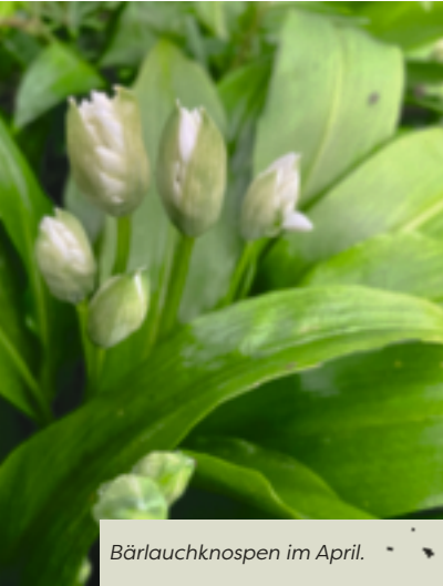
Bärlauchknospen im April.

Bärlauch, eine mehrjährige, krautige Pflanze, wird auch »Wilder Knoblauch« genannt und ist mit Schnittlauch, Zwiebel und Knoblauch verwandt. Bärlauch ist in fast ganz Europa und Teilen Asiens beheimatet, wobei er in Deutschland vor allem im Süden wächst. Wo er sich wohl fühlt, findet man ihn oft in großen Beständen. Er liefert uns von März bis Mai seine Nährstoffpakete in Form von Blatt, Blüte und Zwiebeln. Bärlauch liebt halbschattige, feuchte Mischwälder und wächst auch gerne entlang von Bachläufen. Sein an Knoblauch erinnernder Geruch verrät ihn schon von Weitem. Er erreicht eine Höhe von 20–30 cm. Die lanzettlichen grünen Blätter kommen meist zu zweit aus einer länglichen, schlanken Zwiebel hervor. Während die dunkelgrüne Blattoberfläche glänzt, ist die Blattunterseite