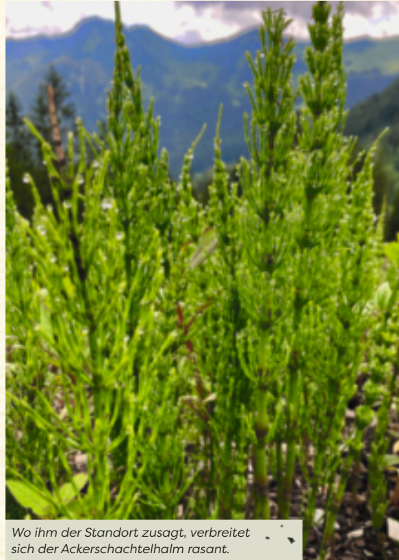
Wo ihm der Standort zusagt, verbreitet sich der Ackerschachtelhalm rasant.

★ Eine weitere Möglichkeit ist das Dämpfen des Krauts: Den frischen oder getrockneten Ackerschachtelhalm in einem Sieb über kochendem Wasser etwa 15 Minuten dämpfen. Das gedämpfte Kraut in ein dünnes Tuch einschlagen oder – etwas abgekühlt – direkt auf die Haut legen und mit einem trockenen Tuch fixieren. Den Umschlag 1–2 Stunden auf der Haut belassen.