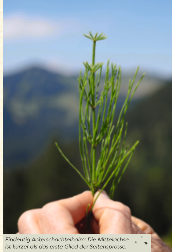
Eindeutig Ackerschachtelhalm: Die Mittelachse ist kürzer als das erste Glied der Seitensprosse.

★ Wichtig zu wissen ist, wie Silizium im Körper wirkt. Dann kann man viele Anwendungsbereiche selbst erkennen. Denn wenn wir das Grundprinzip der Wirkstoffe in den Pflanzen verstanden haben, können wir vieles für uns selbst ableiten. Was ich sehr interessant finde, ist, dass die Kieselsäure des Schachtelhalmes auch festigend auf das Lungengewebe wirkt – denn das besteht ja unter anderem aus Bindegewebe – und deshalb auch bei quälendem Husten eingesetzt werden kann. Zumindest ist es einen Versuch wert.