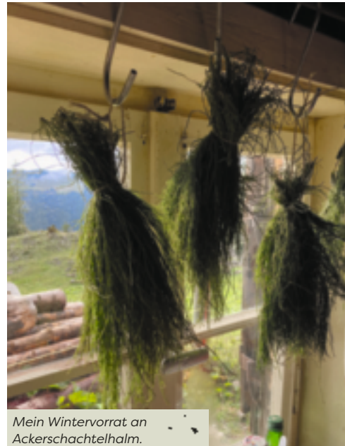
Mein Wintervorrat an Ackerschachtelhalm.

WICHTIG: Die Kieselsäure löst sich erst aus dem Ackerschachtelhalm, wenn das Kraut etwa 30 Minuten in Wasser gekocht wird.