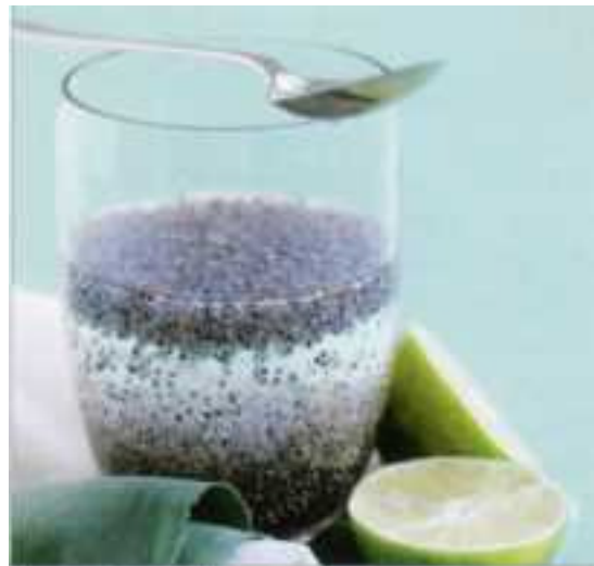
Cholesterinsenkender Superfood-Drink: Verrühren Sie 1 TL Chia-Samen und etwas Limettensaft in einem Glas Wasser.

Granatapfelkerne enthalten besonders viele Antioxidanzien in Form von gefäßschützenden Polyphenolen und Gerbstoffen, außerdem Vitamin B 1 und B 2 , Kalzium, Phosphor und Magnesium. Ein praktischer Tipp: Am besten den Granatapfel gleich in der Spüle aufschneiden - der Saft macht Flecken. Die Kerne schmecken gut in Joghurt und Quark, aber auch in Obstsalaten und pikanten Salaten. Granatapfelsaft kann man anstelle von Essig in der Küche verwenden.