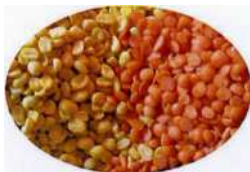
gelbe & rote Linsen (Masoor- & Mungdal)

Kokosnussmilch hat im Durchschnitt 23% Fett, ist jedoch rein pflanzlich. Auf Grund dieser Eigenschaft wirkt Kokosnussmilch cholesterinhemmend und ist tierischen Fetten vorzuziehen.