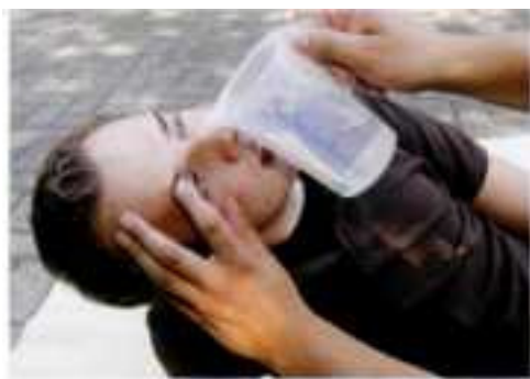
Abb. 13.2 Augenspülung: Das Auge am besten mit einem Tupfer offen halten. Die Spüllösung oder klares Wasser aus 10 cm Entfernung von innen nach außen laufen lassen. Werden Säuren, Laugen oder andere Chemikalien ausgespült, muss der Helfer zum Selbstschutz Handschuhe tragen. [FLA]

Ein Glaukom entwickelt sich meist über einen längeren Zeitraum. Bei einem akuten Glaukomanfall dagegen erhöht sich der Augeninnendruck plötzlich.