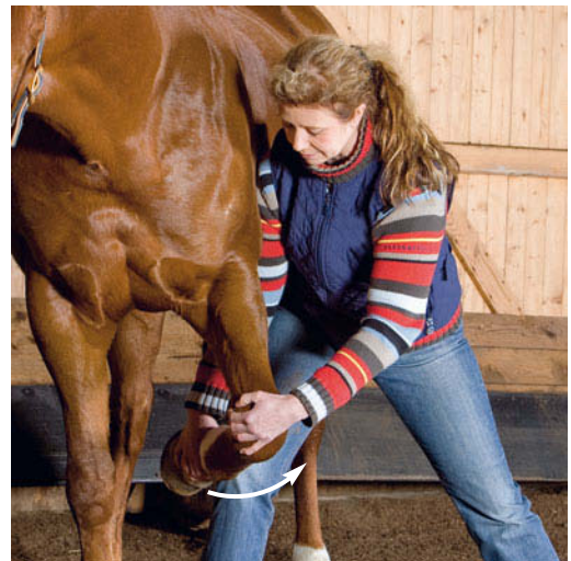
► Abb. 6.7 Untersuchung des Schulter- bzw. Buggelenks in Außenrotation und Abduktion (Öffnung).