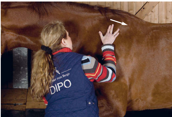
► Abb. 6.2 Untersuchung der Skapula: Rotation nach kaudal.

Hierbei wird die Schultergliedmaße möglichst weit nach medial unter den Rumpf geschoben. Der proximale Anteil der Skapula entfernt sich dabei vom Rumpf.