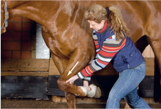
► Abb. 6.5 Untersuchung des Schulter- bzw. Buggelenks in Extension.

Flexion und Extension werden getestet, aber nicht korrigiert.