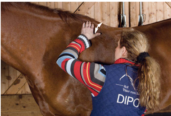
► Abb. 6.3 Untersuchung des Skapulagleitens nach dorsal und ventral.