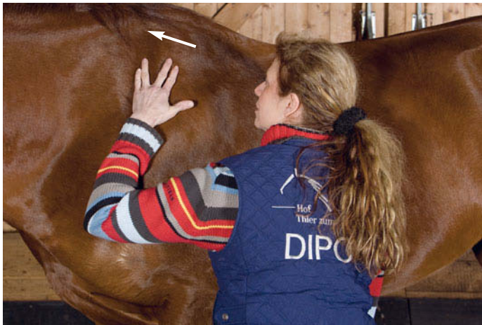
► Abb. 6.1 Untersuchung der Skapula: Rotation nach kranial.

Der Therapeut stellt sich seitlich an das Pferd, mit der Front zum Schulterblatt. Die Vordergliedmaße wird in „Tripleflexion“ gebracht. Für die Rotation nach kranial befindet sich die rechte Hand am Röhrlbein oder der Fessel, während die linke die Bewegung des Schulterblatts an der Spina scapulae oder am Schulterblattknorpel verfolgt. Hierbei wird die Gliedmaße nach hinten geführt, wobei sich der Schulterblattknorpel nach kraniodorsal bewegt (► Abb. 6.1).