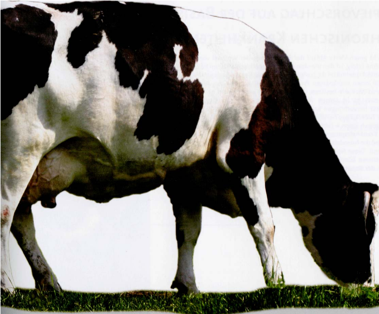
Tuberkulose beim Rind: (42)

Zwischen 1936 und 1950 waren ca. 2/3 aller Rinder an Tuberkulose erkrankt. Der gesamte Rinderbestand wurde Tuberkulin-Tests unterzogen. Die Sanierung geschah durch Ausmerzungen. Durch unphysiologisches Einbringen eines Tuberkuloseerregers in den Organismus durch die flächendeckenden Tests wurde die Information der Tuberkulose an den gesamten Rinderbestand gegeben.