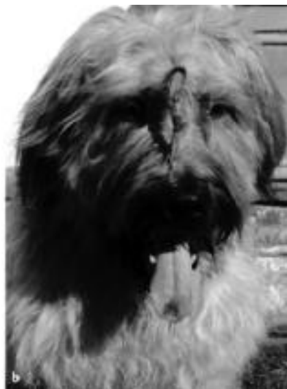
► Abb. 8.1 Duke, ein 11-jähriger stolzer Briard-Rüde – Vorher und Nachher (Quelle: Marco Nehring, Anke Nehring, Biebergemünd).