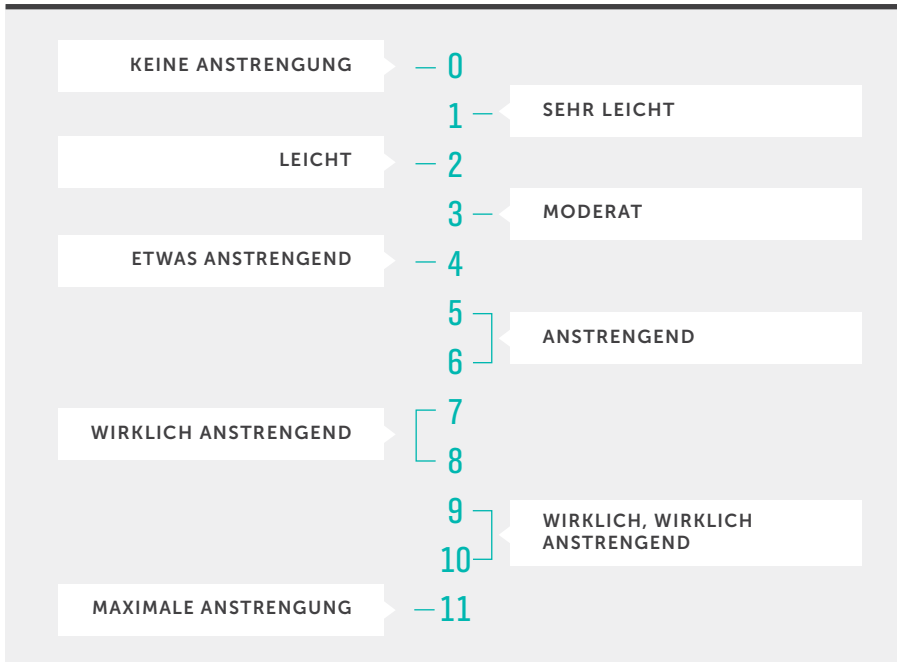
ABBILDUNG 4.1. Muskelbelastung/RPE-Skala

Wie sehr strengen Sie sich an? Es braucht Übung, aber die Verwendung des RPE-Werts für das Monitoring Ihrer Anstrengung wird Ihre Sensibilität für die PowerTrain-Zonen entwickeln.