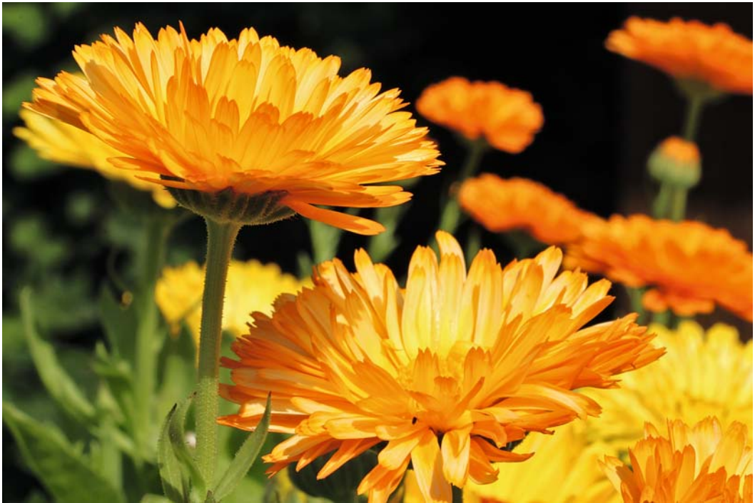
► Abb. 7.1 Calendula wirkt heilend auf Wunden.

auf 1 Liter Wasser, 1–3-mal täglich anzuwenden; bei noch intakter Haut kann die Essenz auch unverdünnt eingerieben werden.