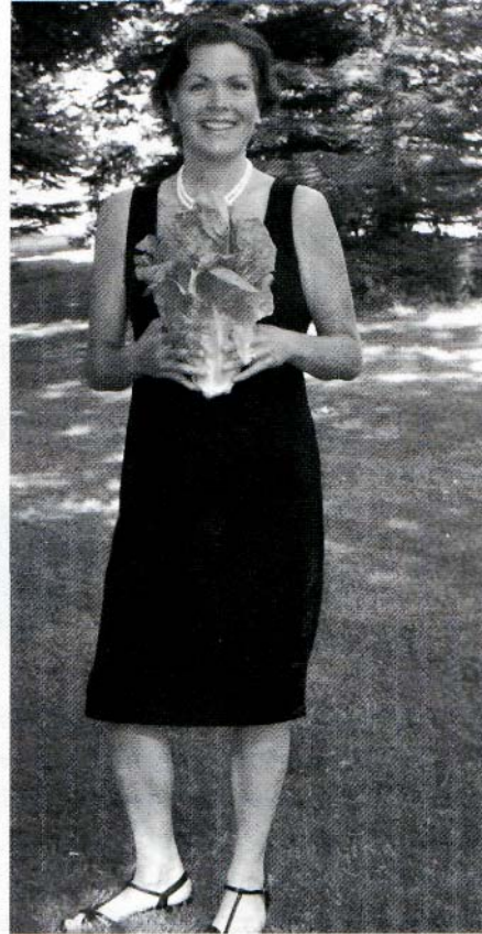
... und im Juni 2009

Tatsache ist, dass wir Superimmunität heute dringender brauchen denn je. In den Vereinigten Staaten können Erwachsene damit rechnen, sechs- bis zehnmal im Jahr eine Erkältung zu bekommen. Alle diese Erkältungen zusammen kosten die amerikanische Wirtschaft direkt und indirekt rund 40 Milliarden Dollar. Außerdem ist es kein Vergnügen, krank zu sein. Aus einer Grippe kann beispielsweise eine lange, ernste Krankheit werden. Mediziner warnen vor möglichen neuen Grippeviren, und Viruskrankheiten breiten sich heutzutage weltweit aus. Darum ist es wichtig, dass unser Immunsystem stark bleibt und dass wir uns und unsere Familien schützen. Bei Men-