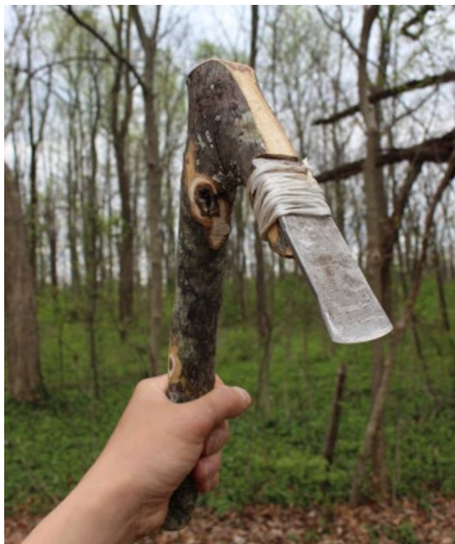
Provisorische Queraxt mit Metallschneide

Wenn Sie den Ast mit dem zugehörigen Stück des Stamms abgeschnitten haben (siehe Foto), müssen Sie das dickere Ende so zurechtschneiden, dass Sie daran die Schneide befestigen können. Der dicke Stammanteil ist ein wesentliches Konstruktionselement. Die Schneide wird daran mit einem Bindetackling festgemacht (siehe Skill # 74).