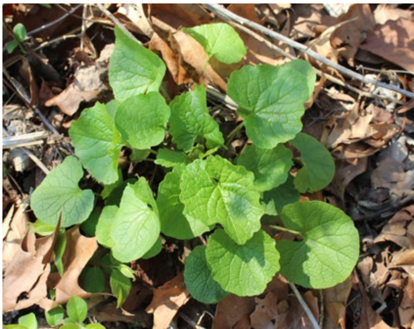
Knoblauchsrauke im ersten Entwicklungsjahr mit auffallend ausgeprägten Adern

Die Knoblauchsrauke zählt zu den wenigen wilden Pflanzen, die im Winter auch durch die Schneedecke hindurchstoßen. Sie ist extrem kälteresistent und wächst den ganzen Winter über. Die Alliaria petiolata ist eine zweijährige Pflanze, hat also einen zweijährigen Lebenszyklus. Im ersten Jahr treiben die runden, fast herzförmigen Grundblätter aus (siehe Foto). Die Blätter sind stark von Adern durchzogen – was mir persönlich am Anfang sehr geholfen hat, die Pflanze zu erkennen. Im zweiten Jahr bildet die Pflanze ihren Stängel mit kleinen weißen Blüten und langen, röhrenförmigen Schoten aus. Die Blätter schmecken nach Knoblauch (und riechen auch so, wenn man sie zermahlt). Der Nachgeschmack ist meiner Meinung nach etwas bitter. Das gilt vor allem für ältere Pflanzen. Nützlich sind sie vor allem zum Würzen von Eintöpfen oder von Fischen und Wildvögeln (als Füllung). Die kleinen schwarzen Samen finden sich im zweiten Entwicklungsjahr den ganzen Winter über. Sie schmecken nach Rettich und können dazu verwendet werden, gekochtes Wurzelgemüse aufzupeppen.